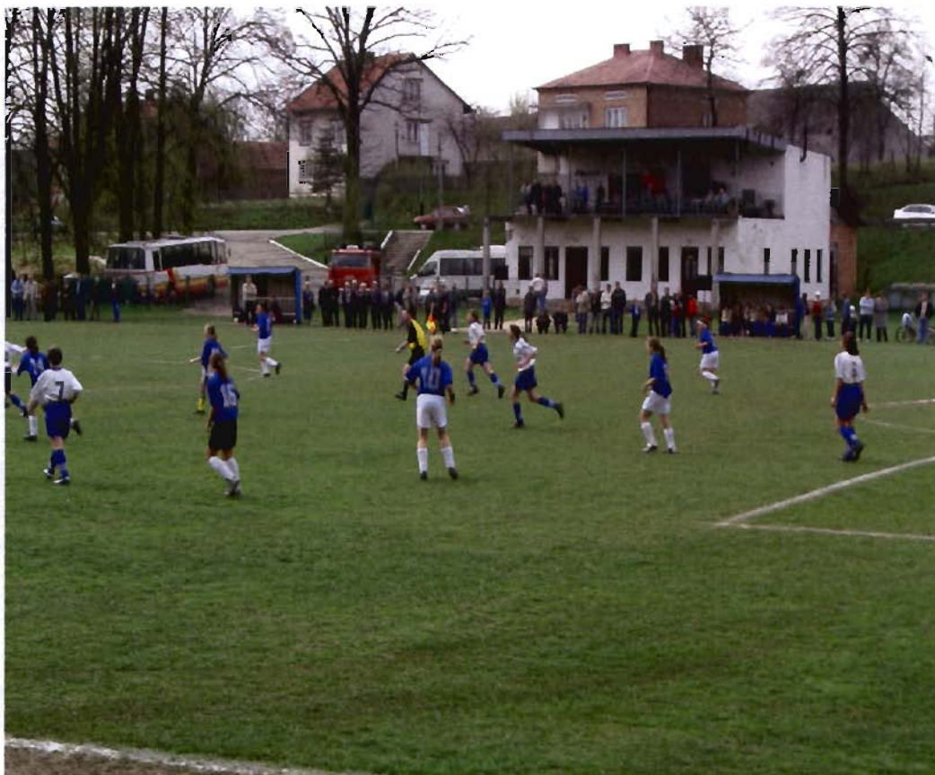
Rysunek 2 Szatnia sportowa i stadion w Grodzisku Górnym (budynek przed modernizacją – stan pierwotny)

W latach 1994 – 1996 sporządzono i opracowano niezbędną dokumentację techniczną oraz uzyskano konieczne pozwolenia do przeprowadzenia modernizacji i rozbudowy całego stadionu wraz z urządzeniami towarzyszącymi (I etap inwestycji). Koszt tego etapu to 26 000 zł, w tym 15 000 w ramach budżetu gminy i 11 000 ze środków budżetu państwa. W roku 2005 nastąpiła aktualizacja i adaptacja istniejących projektów do nowych warunków i obowiązującego stanu prawnego (koszt 22 400 zł w całości pokryty ze środków budżetu gminy). Efektem realizacji II etapu inwestycji w latach 2006 – 2007 było nadbudowanie piętra do istniejącego budynku szatni, wykonanie nowego pokrycia dachowego oraz stolarki wewnętrznej i zewnętrznej, tzw. stan surowy zamknięty. Koszt II etapu – 420 000 zł, w całości ze środków własnych gminy.