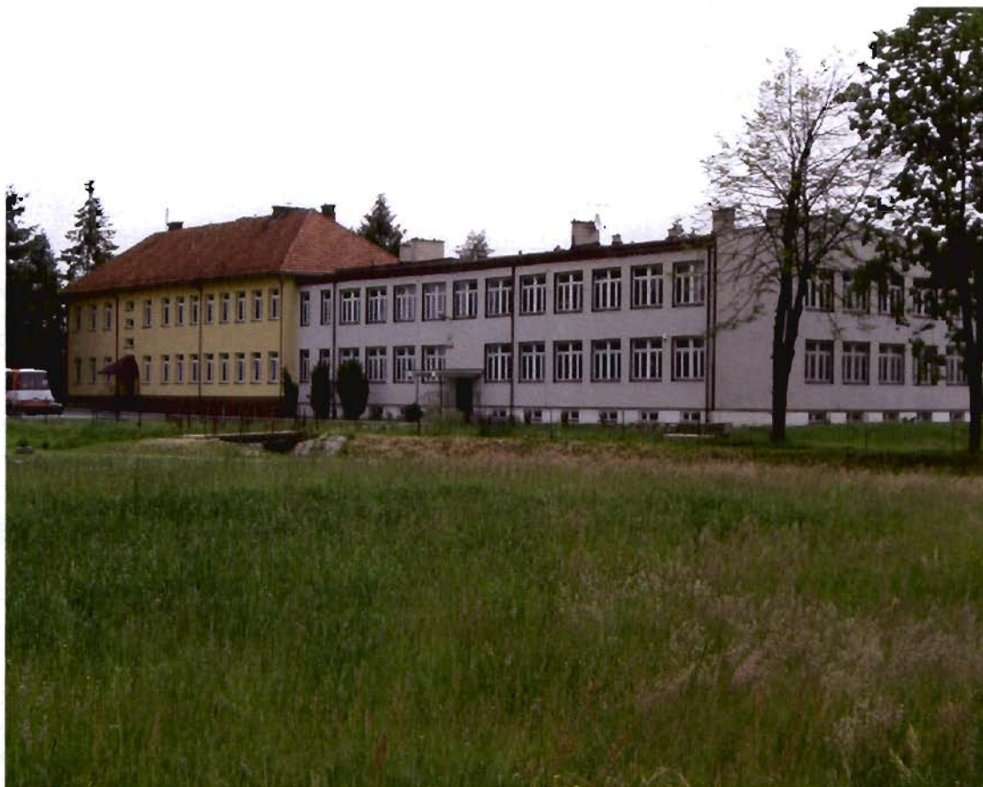
Rysunek 1 Zespół Szkół w Grodzisku Górnym im. Prof. Franciszka Leji

W centrum wsi Grodzisko Górne przy drodze powiatowej znajduje się Zespół Szkół im. prof. Franciszka Leji. Mieści się tu Przedszkole Samorządowe, Szkoła Podstawowa i Gimnazjum, do której łącznie uczęszcza 410 osób, w tym 361 uczniów (dane z roku szk. 2007/08).