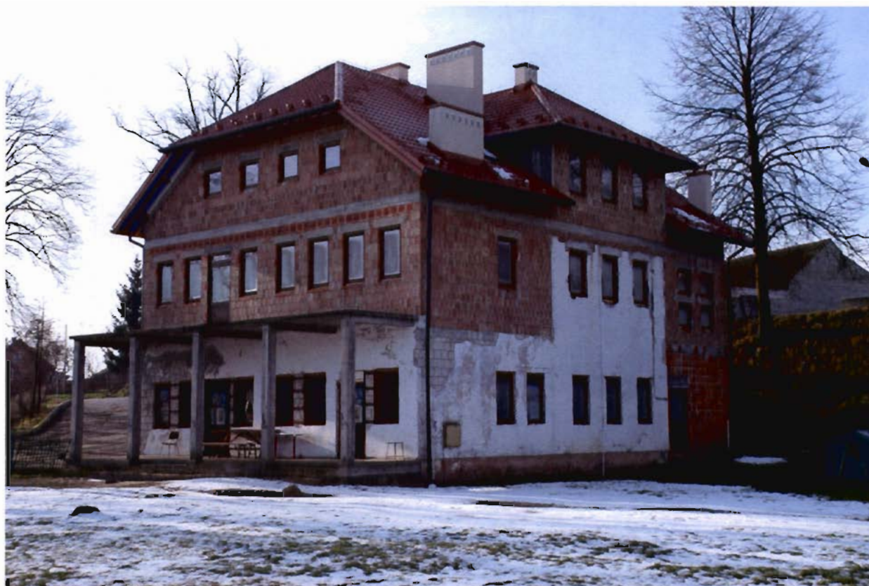
Rysunek 4 Szatnia sportowa w Grodzisku Górnym (budynek po częściowej modernizacji – stan obecny)

W latach 2008 - 2009 planowana jest dalsza modernizacja szatni sportowej i stadionu w celu stworzenia nowoczesnej bazy sportowej, wypoczynkowej, kulturalnej i społecznej służącej nie tylko mieszkańcom wsi, ale również gminy i całego regionu.